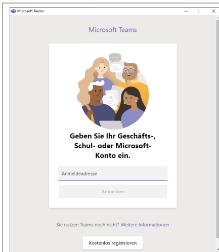
Am Teams-Client anmelden